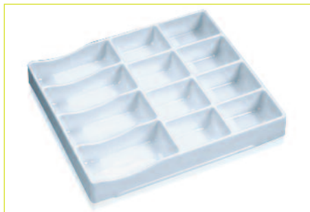
accessori: separatore di moneta accessories: coin divider

ACCESSORI: SEPARATORE DI MONETA ACCESSORIES: COIN DIVIDER